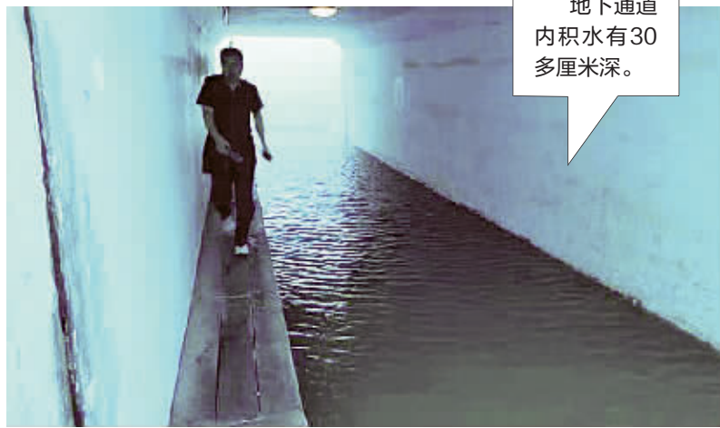
地下通道内积水有30多厘米深。

直到记者截稿前,工作人员和民警们仍旧在现场轮班守护,以防止不必要事故的发生,他们也希望通过本报提醒市民,再好的东西,也没有生命重要。