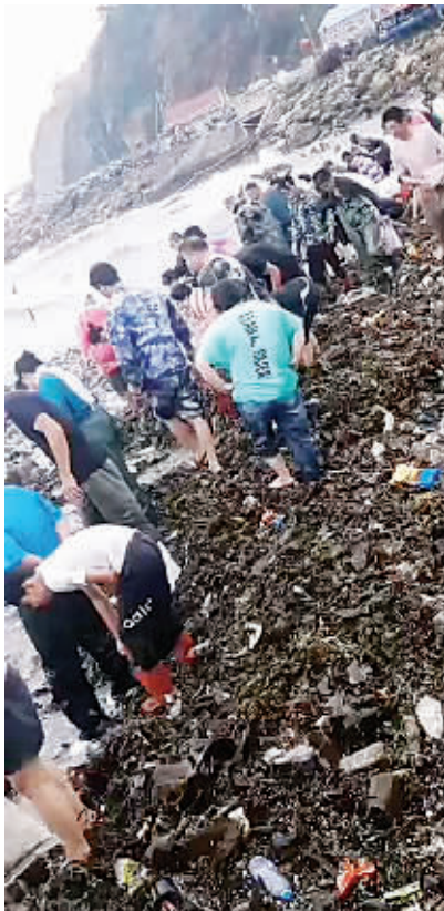
海边有很多市民在捡拾海参。

本报讯 12日下午,朋友圈里突然流传出一段视频,很多人聚在海边捡拾着什么,视频里说,旅顺盐厂的海滩上有海参,让大家快去捡,不过视频里也提到,海浪很大,可仍旧不忘介绍他们捡拾了许多大个儿的海参。