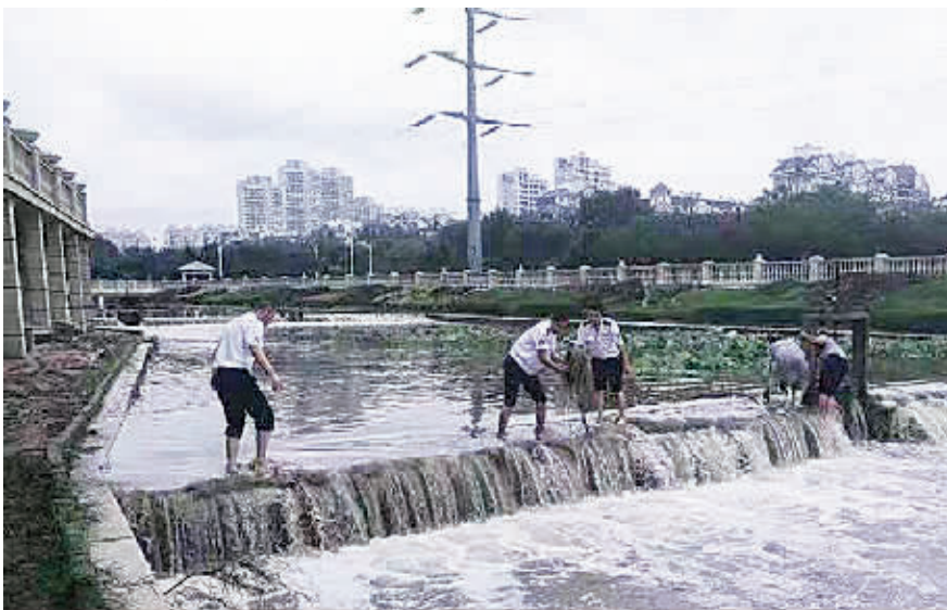
大家齐心协力在河道内打捞杂草杂物。