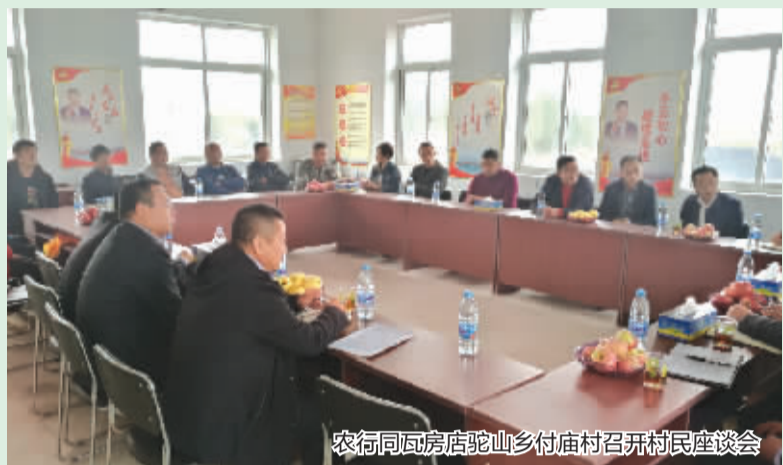
农行同瓦房店驼山乡付庙村召开村民座谈会

这个来自辽宁省瓦房店市驼山乡付庙村的青年汉子,经营反季樱桃大棚多年,凭着自己的7栋暖棚2018年樱桃销售纯收入六十余万元。